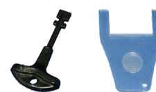
Clé de réarmement et outil de test

Notes : 1/ tous les écrans de câble doivent être protégés par un sculptiseau. 2/ il convient de dénuder les conducteurs sur au moins 8mm. 3/ les déclencheurs doivent être adressés avant d'être mis en place.